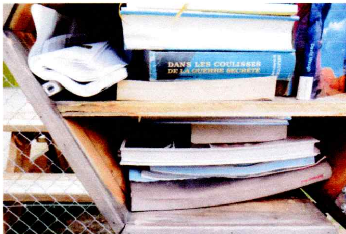
Stockage des livres