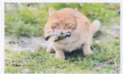
Il y a environ 1,7 million de chats domestiques en Suisse, qui font des dégâts très importants parmi la faune à plumes.