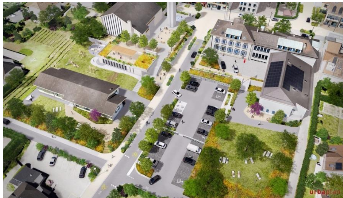
2. Travaux sur les parcelles n° 314, 369 et 370