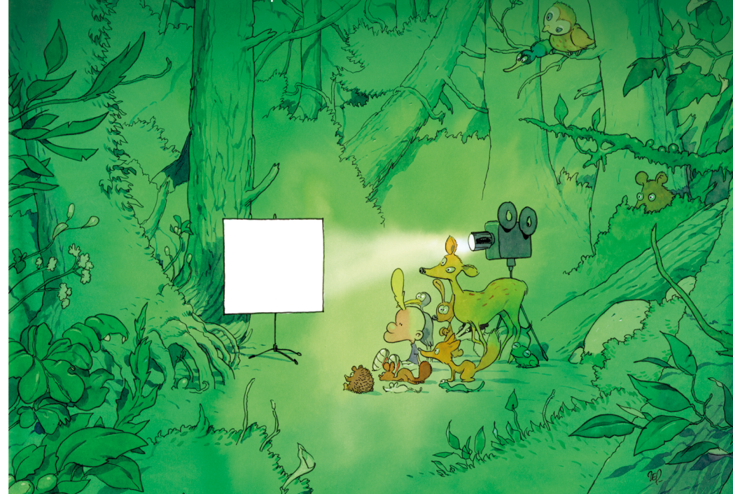
Illustration: ZEP / graphisme: vosimages.ch